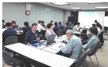
集合研修会を受講される参加事業者の皆様